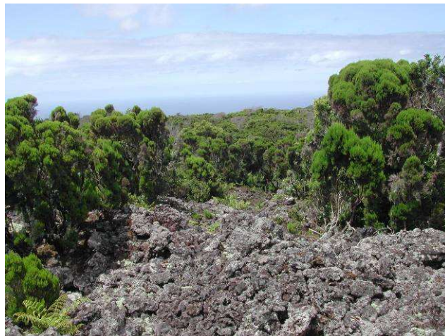
Photo 5 – Paysage modifié par l'éruption de 1761 | Foto 5 - Paisagem alterada pela erupção de 1761

O Pico do Fogo é o local onde se deu a segunda erupção de 1761, quatro dias depois da primeira, que aconteceu na zona dos Mistérios Negros, entre o Pico Gordo e a Serra de Santa Bárbara. A segunda erupção, deu então origem ao Pico do Fogo, Pico Vermelho e Pico das Caldeirinhas, desenvolvendo-se também segundo os relatos da época, em três correntes de lava, a primeira rumo a oriente, com paragem num local designado de Chama a segunda dirigiu-se para Ocidente, lançando uma propagação para Norte até ao Tamujal, e a terceira a superior, deslocou-se para Norte, dividindo-se posteriormente em duas, uma das quais estagnou no Vimeiro e a outra foi dar ao Juncalinho, chegando mesmo a invadir os Biscoitos e a destruir algumas casas (Foto 5).