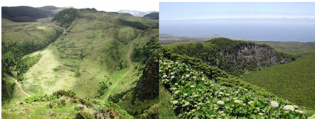
Photo 2 et 3 – Vue de la Roche du Chambre | Foto 2 e 3 - Vista da Rocha do Chambre

Do alto da Rocha do Chambre (Foto 2 e 3), pode-se observar um riquíssimo património natural: a Reserva Florestal da Serra de Santa Bárbara e dos Mistérios Negros, a Reserva Florestal Natural Parcial do Biscoito da Ferraria, a Serra do Labaçal onde está inserido o belo Morro Assombrado, o Biscoito Rachado, o Pico das Pardelas, o Pico Alto, a Terra Brava, o Pico Agudo e o Pico do Tamujo. Em dias de boa visibilidade é possível observar a Ilha Graciosa.