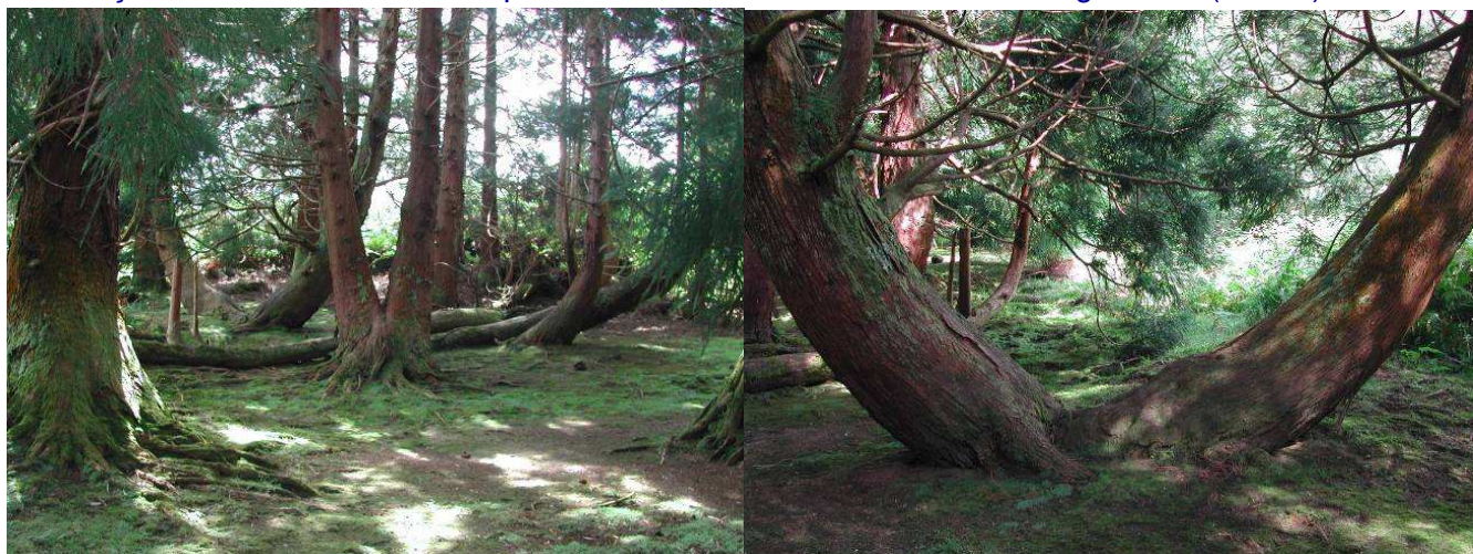
Photo 4 – Forêt de criptomérias, lieu de pic-niq | Foto 4 - Mata de criptomérias, local de pic-niq

O almoço faz-se numa mata de criptomérias bem desenvolvidas e muito agradável (Foto 4).