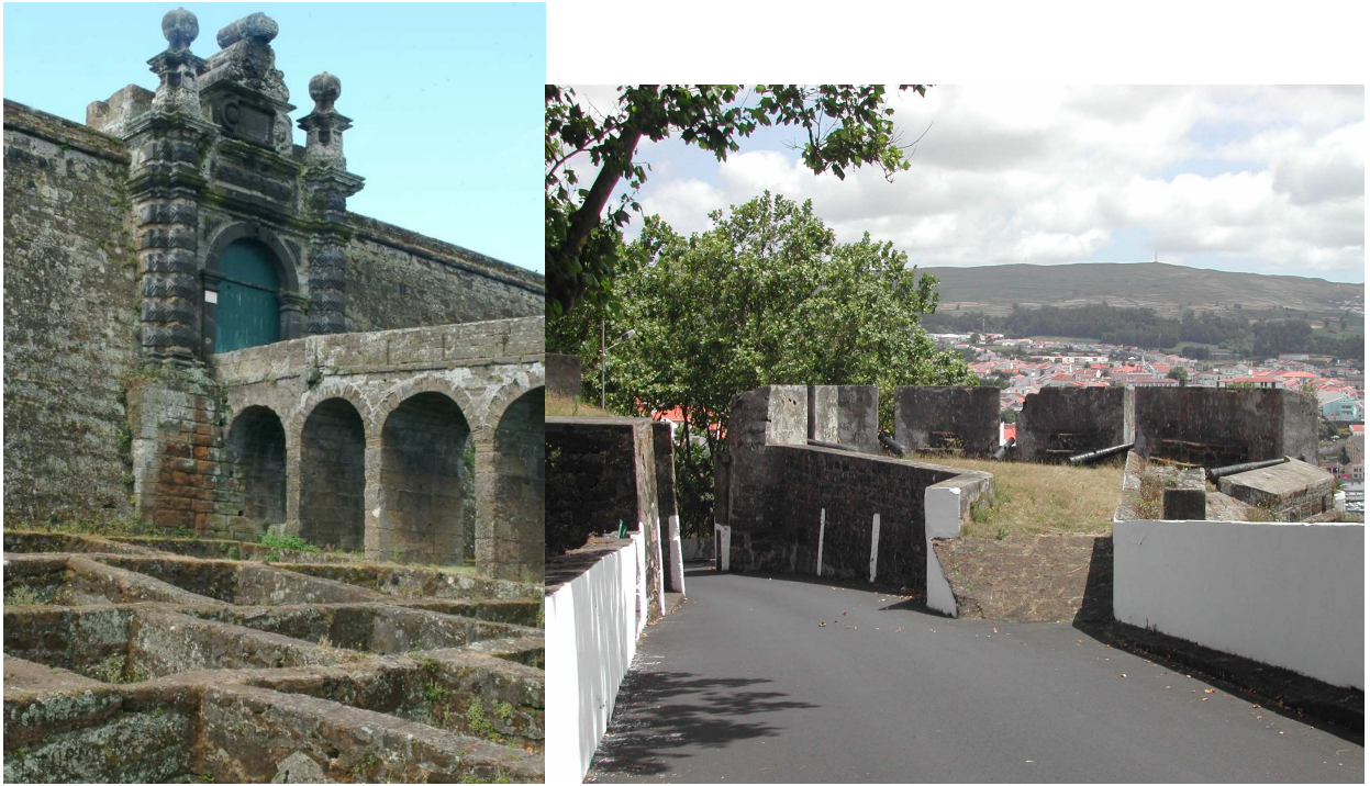
Photo 6 – São João Baptista Fortress Foto 6 - Fortaleza de São João Baptista