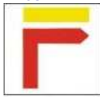
Touner à droite Turn Right Vire à direita