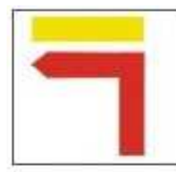
Touner à gauche Turn Left Vire à esquerda

Cette route est circulaire, commence et termine joint du Relvão, une région où il ya un parc de diversion.