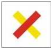
Mauvais chemin Rong way Caminho errado