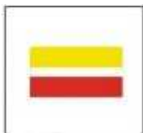
Droit chemin Right way Caminho certo