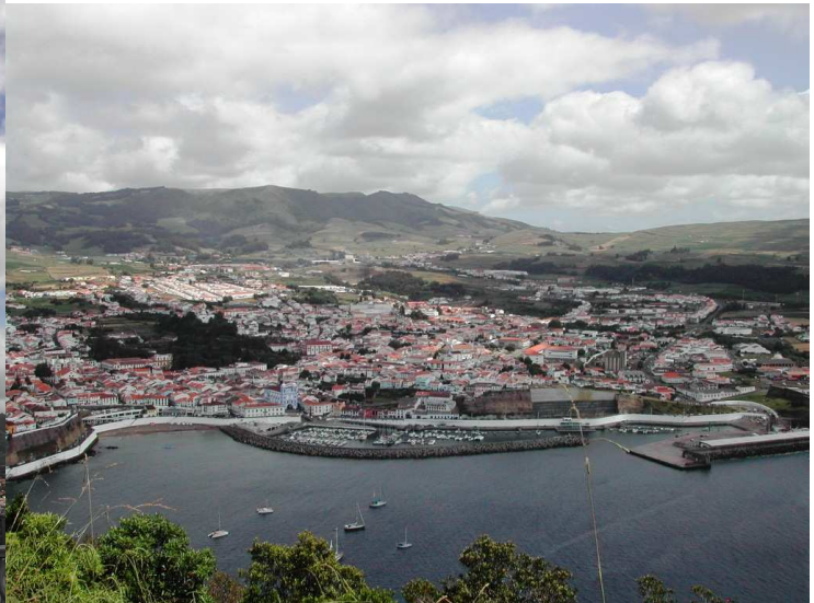
Photo 4 – Panoramic vue over Angra's town. Foto 4 - Vista panorâmica sobre a cidade de Angra

Descente de la dernière partie du parcours, vous arriverez au point de départ.