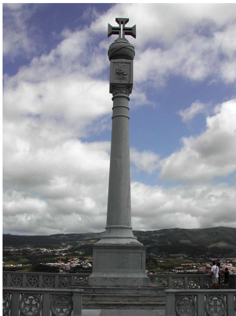
Photo 3 - Pico das Cruzinhas Foto 3 - Pico das Cruzinhas

Seguindo pelo caminho de asfalto e virando por um desvio à esquerda chega-se ao Monumento dos Descobrimentos denominado de Pico das Cruzinhas . Deste ponto podemos apreciar uma bela vista panorâmica sobre a cidade de Angra.